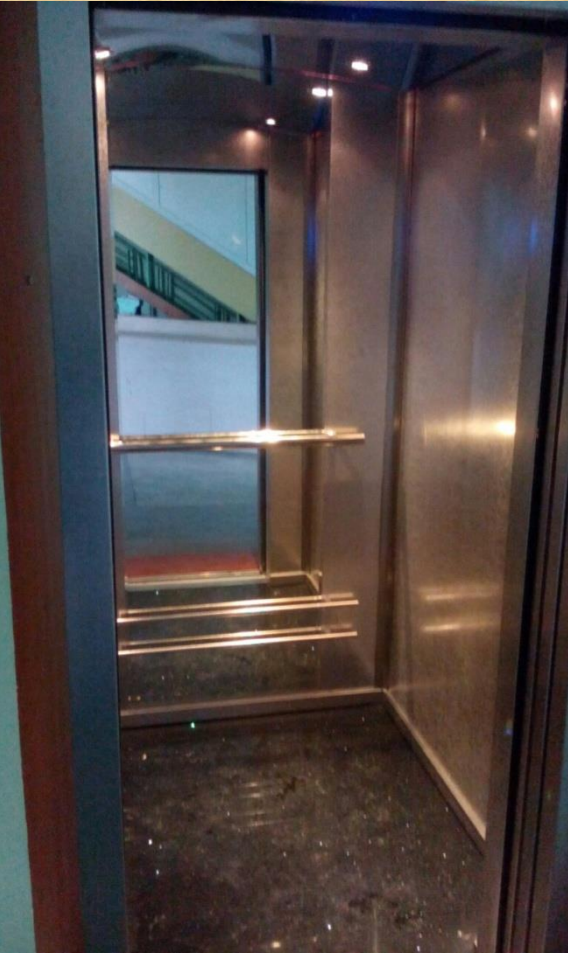
Alba Iulia, 206